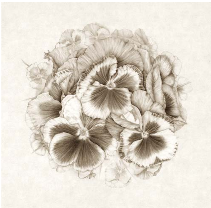
Imagen de la plancha