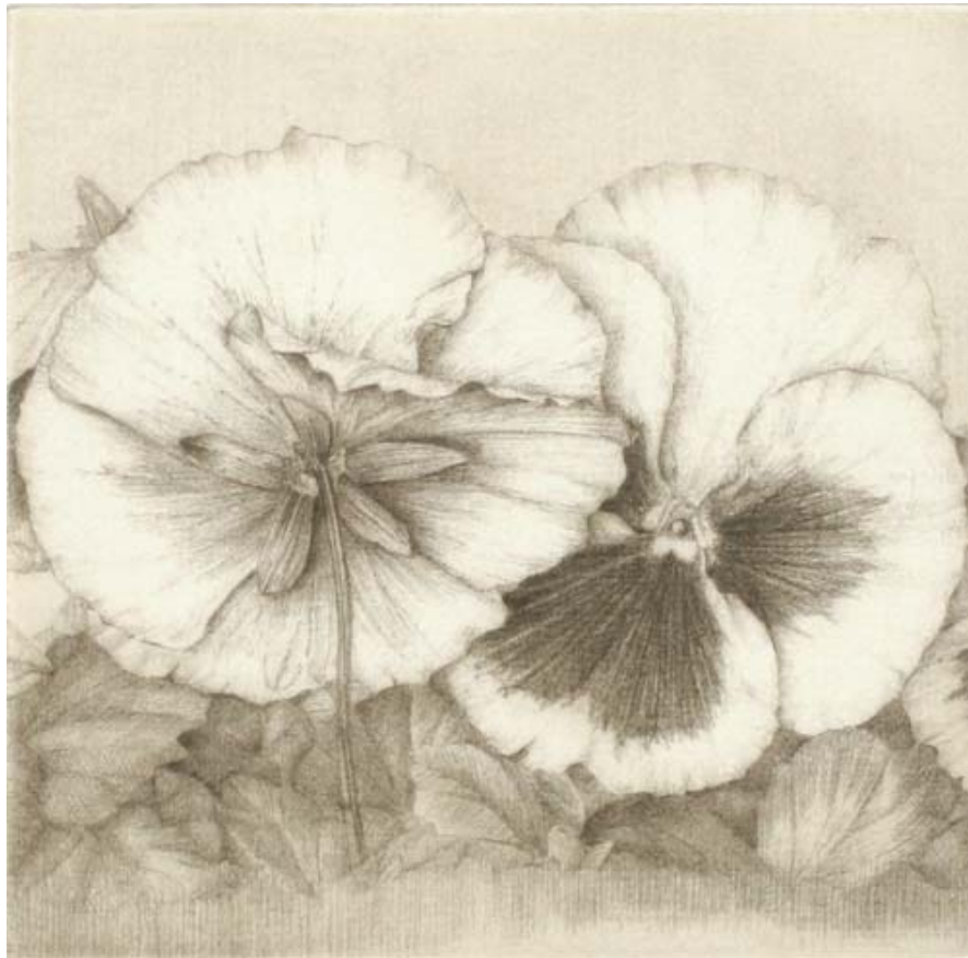
Imagen de la plancha